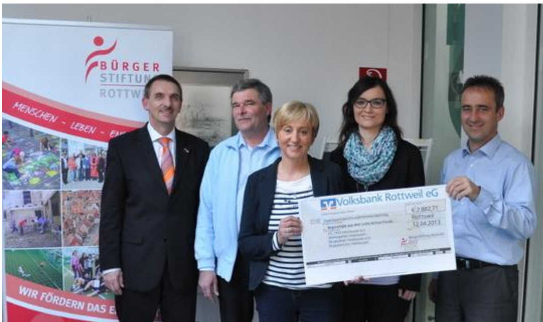
Die Bürgerstiftung Rottweil übergibt die Überschüsse 2012 aus dem „Lotte-Kröner-Fonds“.